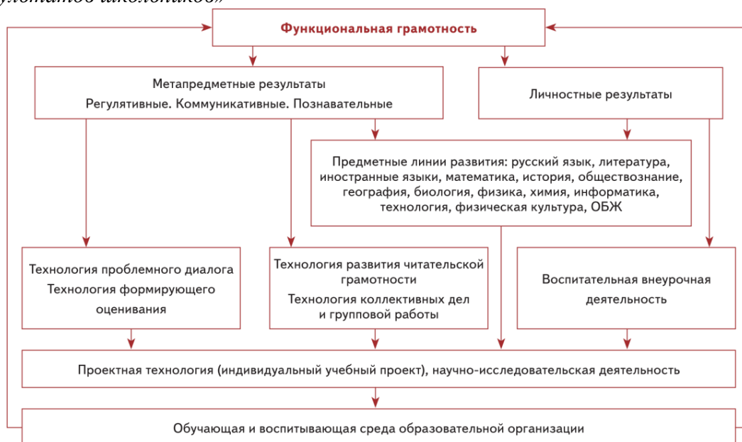
Схема «Система работы школы по обеспечению личностных и метапредметных (УУД) результатов школьников»

Из схемы видно, что существует несколько механизмов развития личностных и метапредметных результатов: